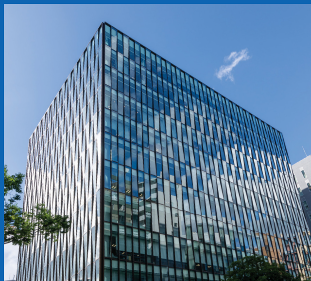
福岡営業所 (博多FDビジネスセンター)