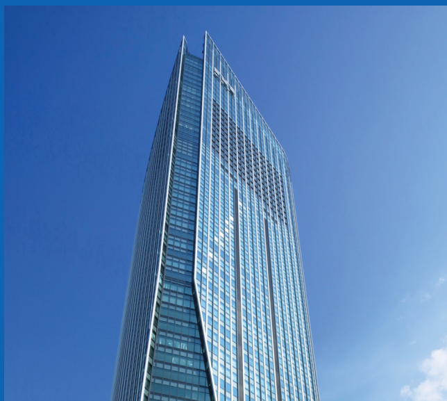
東京本社 (虎ノ門ヒルズ森タワー)

当社では、機関投資家のお客様に対し、信託業務、アウトソーシング業務、グローバル・カストディ外国銀行代理業務、オフショア・ファンド・サポート業務、ポートフォリオ・ソリューション業務、およびファイナンス・ソリューション業務、グローバルリンク、そしてステート・ストリート Alpha、証券代理人業務を提供しています。